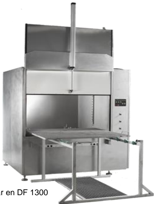
Bilden visar en DF 1300

Övriga storlekar och utföranden på begäran. Toppmatade spoltvättar. Tryck här